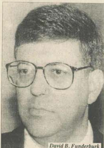
David B. Funderburk

Există tradiția unei politici externe bipartizane aici în America. Dar se pot întrevădea deosebiri de accent și abordare, având în vedere că unii dintre republicani, în special senatorul Jesse Helms, care ar urma să preia în ianuarie președinția Comisiei de afaceri ex-