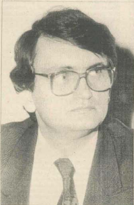
Născut în 1954. Absolvent al Facultății de Drept (1979) ca șef de promoție. Judecător (sectorul 5), apoi la Procuratura Generală București, anii 1979-1987. Din 1984 predă la Facultatea de Drept. Doctorand, specialitatea Drept comercial și Drept civil. Președintele Sindicatului din Universitatea București (martie 1990), președinte al CNSLR (iunie 1990), Președintele CNSLR-Frăția (1993-1994). Președinte al Confederației Sindicatelor Democratice din România (CSDR), ales la Congresul de constituire din 22-23 octombrie a.c.

Fără îndoială, Guvernul și actuala Putere vor încerca să adopte măsuri discriminatorii în funcție