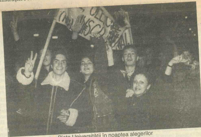
Piața Universității în noaptea alegerilor