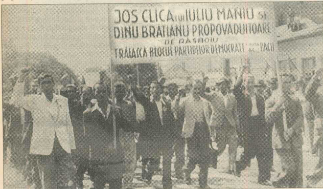
Violența, singurul argument al comuniștilor împotriva partidelor istorice

Ceea ce s-a întîmplat în România la 19 noiembrie 1946 se petrecuse cu un an înainte în Bulgaria și avea să aibă loc în Polonia la 19 ianuarie 1947, în Ungaria la 31 august 1947 și, în anul următor, la finele lui mai, în Cehoslovacia. Scenariul în cele trei țări, doar actorii au fost diferiți, aceștia avînd însă o trăsătură esențială comună, aceea de a fi fost în solda Moscovei pentru a aplica modelul, elaborat la Kremlin, de sovietizare a centrului și sud-estului Europei, aflat, la sfîrșitul războiului mondial, sub ocupația Armatei Roșii.