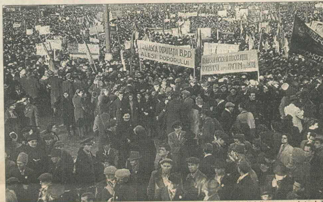
22 noiembrie 1946. După înfrîngerea din alegeri, comuniștii sărbătoresc „victoria”

În ciuda tuturor manevrelor comuniste de timorare a opiniei publice, de șicanare și persecutare a partidelor politice din opoziție, în ciuda climatului de teroare instaurat în țară de guvernul Petru Groza, acesta folosindu-se atât de poliție și serviciile secrete ajunse sub controlul unor agenți NKVD de