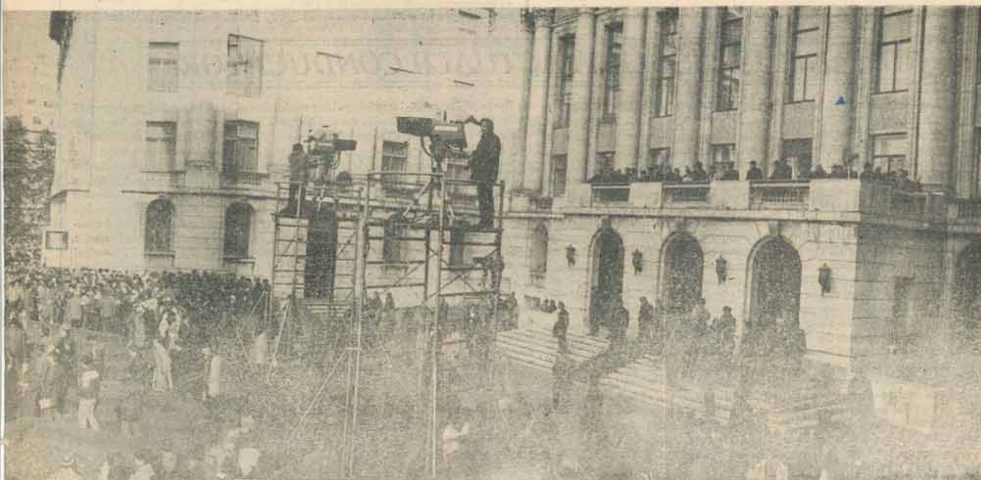
Fotografie de primă mână