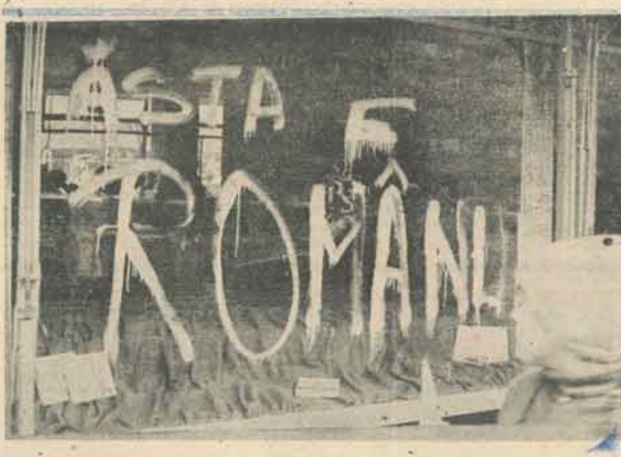
Române, să dorm eu pe moale”, „privatizează-te Române, să rămîn eu bogătaș de stat”.

Cînd în noaptea aceea de sfîrșit un crainic al televiziunii chema pe tineri și bătrîni să apere fără arme, cu plepturile goale acest nucleu vital al țării, ei reîn-cepea comunismul. Muriți voi, spune crainicul, să trăim noi, nucleul vital al țării. Cînd domnul Petre Roman răspunde întrebărilor liderilor sindicalii: „Dar cine vreți să susține aceste greutăți? Noi toți le suportăm”, ei continuă comunismul. Oare nu avem cu toții salarii de zece de mi de lei și substanțiale avantaje valutare? De ce așta vîlcăreală pentru un fleac de „liberalizare a prețurilor”? Cu toată simplitatea vă spun, domnule Roman: de aceea nu moare comunismul. Ceaușescu nu e o diferență de sistem politic sau social. E începutul mîncării și ucioazii de oameni, e cel ce împieună și crainicul TV ne îndeamnă: „deșteaptă-te