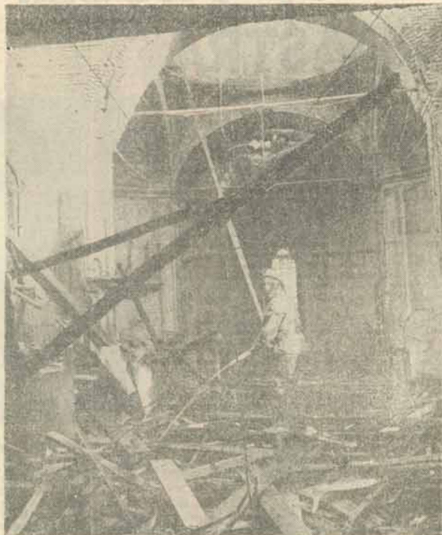
Biserica Sf. Nicolae în ziua referendumului.

Din acest punct de vedere ni s-a părut foarte elocvent un scurt-metraj ger-