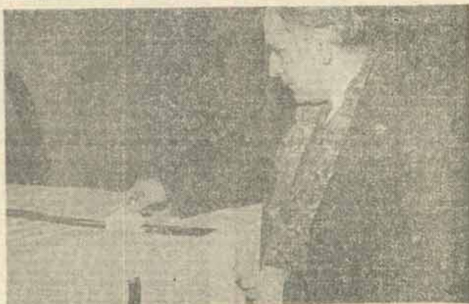
„Revizuirea Constituției poate fi inițiată de Președintele României la propunerea Guvernului, de cel puțin o pătrime din numărul deputaților sau al senatorilor, precum și de cel puțin 500 000 de cetățeni cu drept de vot” (Constituția, art. 146, al. 1)

Oricum, în ceea ce ne privește, am arătat de ce cred că conceptul de „tranziție” trebuie utilizat cu prudență și de ce explicațiile „morale” date crizei noastre de încredere îmi par inconcluzive. În condițiile universalizării limbajului și ideologiei liberale, mă tem că tribalizarea conștiinței publice nu e un fenomen temporar și tranzitoriu. Sfîrșitul istoriei e încă departe, iar Mileniul trebuie să mai aștepte.