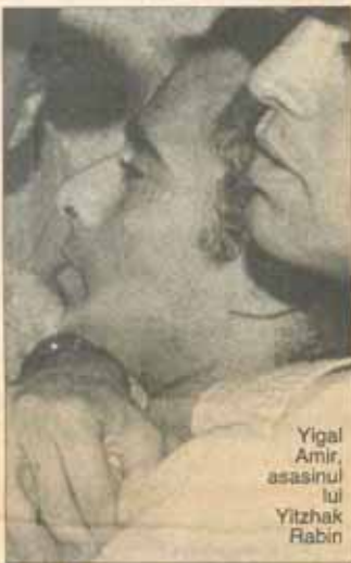
Yigal Amir, asasinul lui Yitzhak Rabin