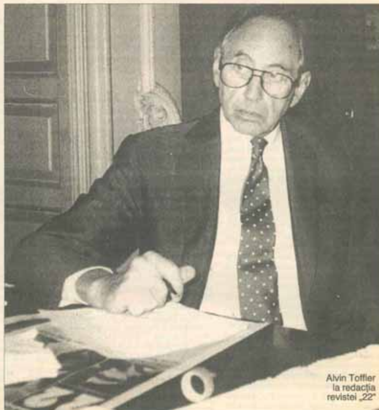
Alvin Toffler la redacția revistei „22”

S-a născut în New York, la 4 octombrie 1928. A studiat la Universitatea din New York, unde a primit titlul de Bachelor of Arts . A obținut, de asemenea, șase doctorate onorifice. A scris, împreună cu soția sa, Heidi Toffler, 9 lucrări, printre care Șocul viitorului (1970), Al treilea val (1980), Puterea în schimbare (1990) și Război și antirăzboi (1993), publicate în peste 50 de țări. Sintezele lor combină elemente din viața de familie, tehnologie, politică, afaceri și mass-media. Alvin Toffler a introdus noi noțiuni în teoria socială și a prevăzut multe dintre schimbările de astăzi, influențând șefi de stat, strategii guvernamentale, politici financiare, ca și climatul intelectual din multe țări. Gorbaciov îl citează în lucrarea sa despre perestroika , iar la apariția cărții Război și antirăzboi , Federico Mayor a organizat o ședință UNESCO pe marginea ei. Alvin Toffler a venit în România invitat de către Banca ING, cu ocazia aniversării primului an de activitate. În timpul șederii sale, a avut întâlniri cu președintele României, membri ai Guvernului, reprezentanți ai Opoziției și ai preslei. A făcut o discuție de aproape două ore la redacția revistei „22”. Materialul care urmează reprezintă o sinteză a ideilor lui Alvin Toffler expuse în cursul vizitei în România.