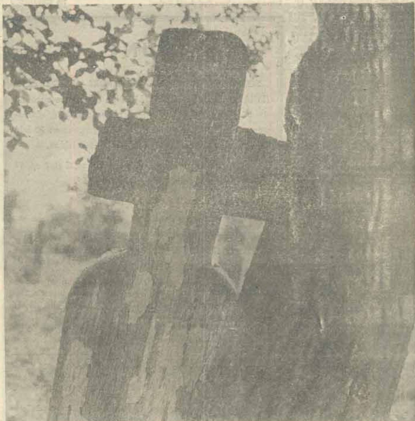
Crucea la Bejan, Hunedoara

Definitiv corect, speranța nu are nimic de a face cu fericirea. Pentru cei cărora nu-i lipsește nimic, problema speranței nu se pune: ce vom mai ști despre speranță, în clipa cînd vom intra în Paradis? Absența speranței poate fi, așadar, trăită în heie nocturnă, ca disperare și în cheie diurnă, ca speranță împlinită, ca suficiență a indigestității. Prezența speranței, în schimb, e de negîndit fără experiența simultană a lipsei, a precarității, a unei ambianțe dezesperante. Speranța e, în definitiv, un corelativ al catastrofei. Ea își dă întreaga măsură, măsura ei de virtute creștină, cînd nici un „motiv” lumesc nu o mai justifică. Intrucît temelul speranței (ca și al credinței) e exterior lumii contingente, nimic din lumea contingentă nu o poate distoca. Cînd sperii, sperii ca Avraam, „împotriva oricărei speranțe” (cf. Romani, 4, 18). Nu sperii fiindcă ai de ce, ci fiindcă nu ai de ce, în ciuda faptului că nu ai de ce. Speranța nu e replică veselă pe care o dăm unei promisiuni. E mai curînd felul omului credincios de a reacționa la ocultarea promisiunii, e o adevărată la rău. De aceea, speranța fără fisură e o virtute rară. Căci răul absolut, fără fisură, e și el rar. Există însă, uneori, o evidență a răului, o carnalitate a lui