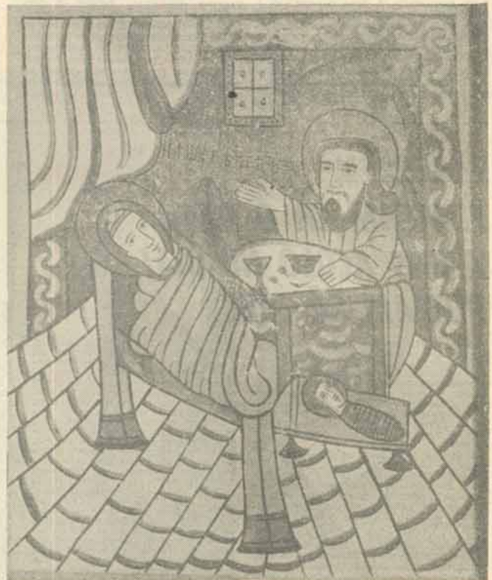
Icoane pe lemn. Muzeul Colețiilor