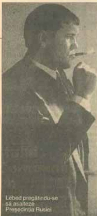
Lebed pregătindu-se să asalteze Președinția Rusiei

3. Chiar dacă o alianță naționalist-comunistă ar dobîndi majoritatea în Parlament, puterea sa de a da înapoi reformele este considerată limitată. Potrivit Constituției ruse, Parlamentul (Duma de Stat) este o instituție slabă, dominată de cea mai puternică Președinție din Europa. „Președinția rusă are mai multă putere decât țara Rusiei, secretarul general al Uniunii Sovietice și faraonul egiptean la un loc”. Este mult adevăr în această descriere exagerată a lui Ghenadi Ziuganov. Legile trecute prin Parlament trebuie ratificate de premier și de președinte. Președintele le poate