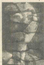
Chipuri și măști ale tranziției