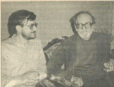
IOAN PETRU CULIANU alături de MIRCEA ELIADE (Groningen, 1984)