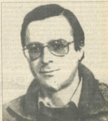
IOAN PETRU CULIANU