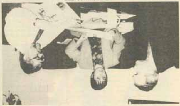
Jurizare directă în GDS