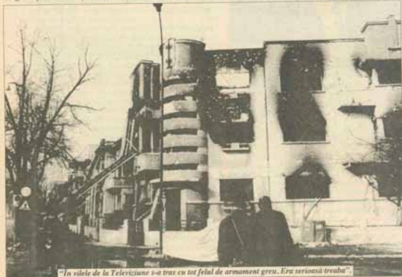
"In vîile de la Televiziune s-a tras cu tot felul de armament greu. Era serioasă treaba".