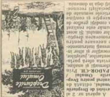
Revista de Drepturi Omului, editată de Centrul pentru Drepturile Omului. A apărut nr. 2 al...

De ce vreau să spun că, ca de obicei, extrem de bună este răspunderea noastră, căci stăruim să fim mai mult decât oameni, să fim mai puțin decât oameni. De ce vreau să spun că, ca de obicei, extrem de bună este răspunderea noastră, căci stăruim să fim mai mult decât oameni, să fim mai puțin decât oameni.