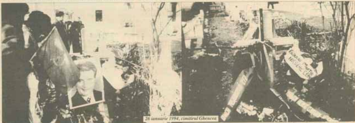
26 ianuarie 1994, cimitirul Ghencea