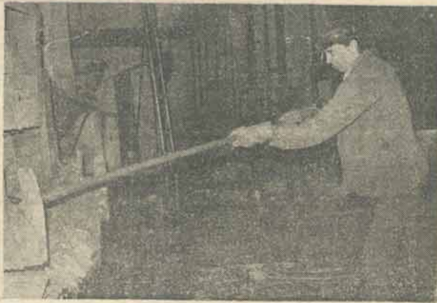
O sută de ani de dezvoltare...