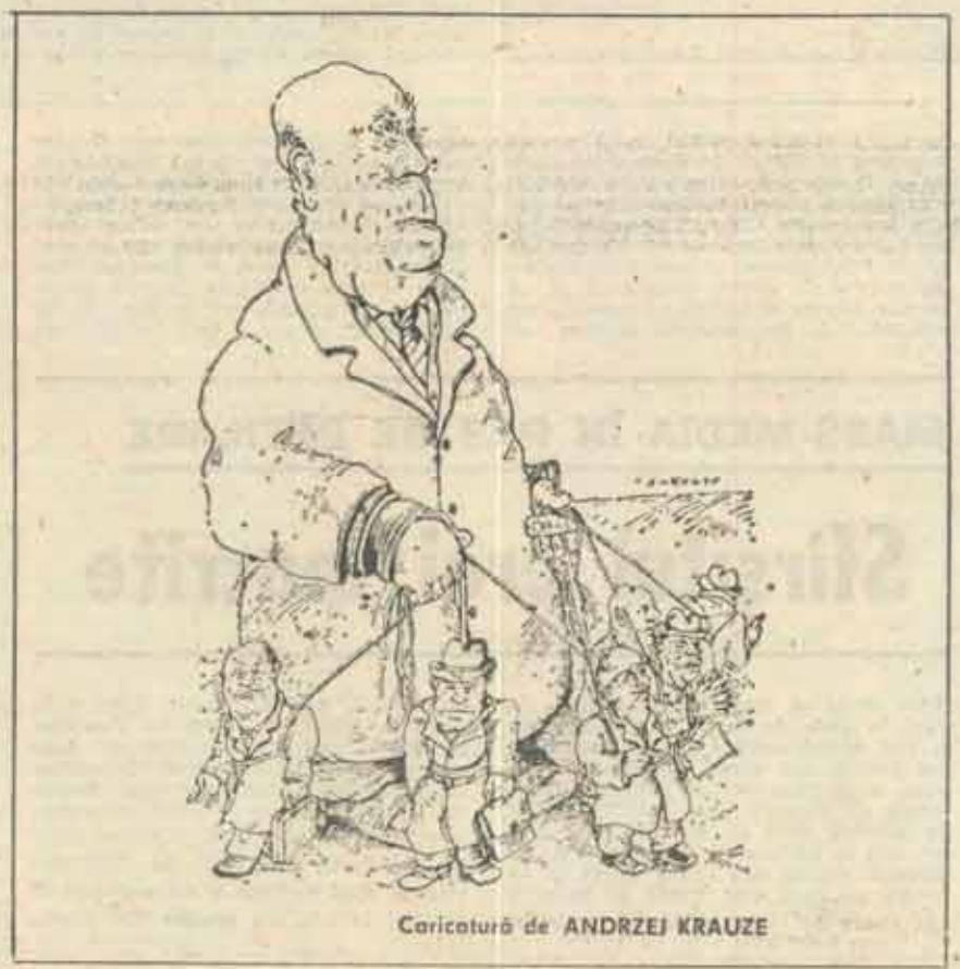
Caricatură de ANDRZEJ KRAUZE

Programul de restructurare a Ministerului Culturii, inițiat de domnul ministru Andrei Pleșu mi se pare a fi coerent și de bun augur pentru cultura noastră. Chiar dacă și el, acest program, conține destule ezitări și firști erori. Iată de ce cred că acest program și ministrul care-l dirijează nu au nevoie de ovații care să-l apere — căci a te apăra de calomnatori de profesie înseamnă cel mai adesea o inutilă risipă de energie —, ci de o solidaritate intelectuală însuflețită de credința curată într-o posibilă renaștere a culturii românești. ■