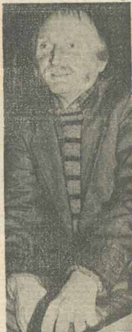
voastră, atunci cînd ați plecat, era considerat a fi unul important. Nu am înțeles suficient de bine care au fost motivele plecării.

(Teatrul Național „Vasile Alecsandri” din Iași, către Comandantul Poliției Municipiului Iași, nr. 2594/18.12.1990)