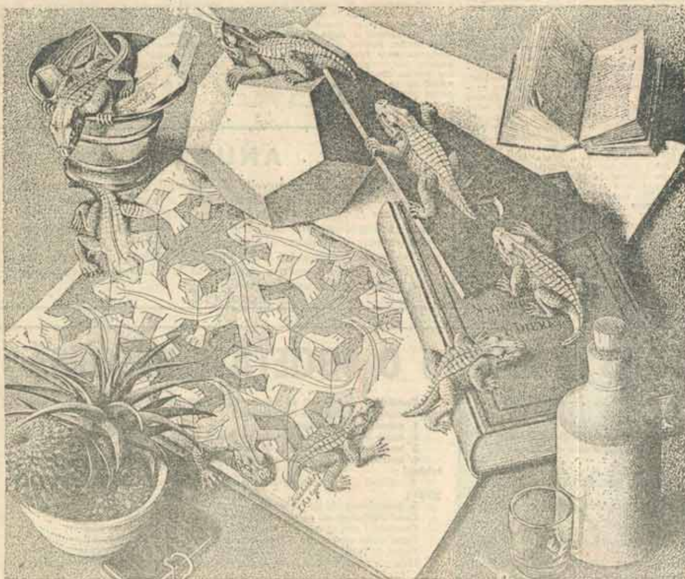
Grafică de MAURITIUS ESCHER

EMINESCU... „Știa ce rol are o presă liberă și onestă în slujirea adevărului, în refuzul cuvintelor mari, în promovarea competenței și demnității intelectuale, în lupta împotriva demagogiei.”