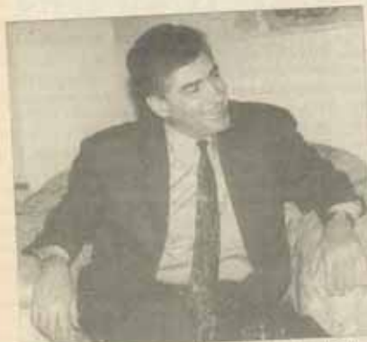
Ce atribuții aveți în calitate de raportor special al Adunării Atlanticeului de Nord?

Misiunea unui raportor al Adunării NATO este de a realiza un document de cercetare la fața locului într-o temă desemnată de către Comitetul permanent al Adunării NATO. În ceea ce mă privește, eu nu lucrez la o temă particulară, o țară sau alta, ci în cadrul unui grup de lucru numit “Noua ordine de securitate europeană” și în cadrul Comitetului politic al Adunării NATO. În această lună are loc la Bruxelles întâlnirea Comitetului politic al Adunării NATO, unde se vor defini liniile principale ce privesc inițiativele acestui comitet politic în cadrul Adunării NATO. Eu am inițiat o temă care urmează să fi aprobată de către Comitetul permanent și care se referă la ceea ce am numit cu descurajarea convențională. Funcția de raportor al Adunării NATO presupune și deplasări în punctele de interes pentru tema considerată, în cazul acesta e vorba de regiunile unde sînt surse potențiale de conflicte și prezentarea unor puncte de vedere care, odată adoptate de Adunarea NATO, devin recomandări pentru NATO.