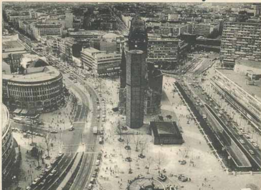
Berlin, Piața Breitscheid, văzută dinspre Europa-Center; a devenit în ultimii ani un loc preferat de întâlniri

În Europa, Germania este țara cu cei mai mulți vecini. De aici și interesul cardinal al diplomației de la Bonn să întrețină raporturi de bună vecinătate cu aceste state, interes dictat mai întâi de propria securitate, de stabilitatea europeană, dar și de dorința ameliorării permanente a imaginii Germaniei în lume. Republica Federală s-a simțit datoră, încă de la naștere, să demonstreze omenirii că statul democratic postbelic nu este prizonierul trecutului său nazist și că joacă un rol de frunte în procesul integrării europene. După încheierea războiului rece și a unificării de stat, politica externă și-a schimbat dinamica. Redobândirea deplină a suveranității, forța economică a Germaniei și cererea comunității internaționale ca acest stat prosper să-și asume responsabilități sporite pe scena mondială au pus capăt pasivității din epoca „genscherismului“.