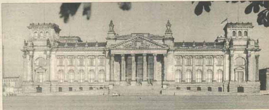
Berlin, clădirea Reichstagului

16-19.06.1982 Vizita unei delegații a Marii Adunări