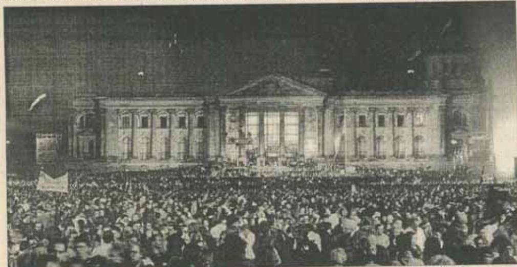
2-3 octombrie 1990, Berlin, Piața Republicii, Reichstag. Germania este o țară liberă și unificată

• Independența landurilor în ceea ce privește majorarea impozitelor, astfel încît cele care consideră că-și pot permite să sporească impozitele pentru a ameliora serviciile publice să o poată face fără a-i obliga pe ceilalți să cheltuiască mai mult decît pot. Această reformă ar accentua diferențele de venituri dintre landurile federale, un lucru pe care reunificarea l-a făcut oricum inevitabil. Avantajul, întrevăzut de unii germani, ar fi renunțarea la sistemul consensual în favoarea unui federalism mai competitiv.